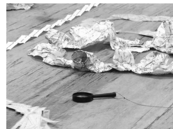
TIEMPO MEMORIA OLVIDO INSTALACIÓN Roberto Galván