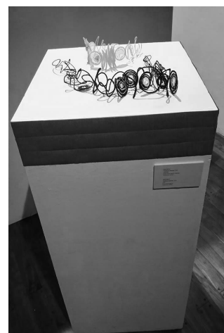
TERRITORIOS INTERIORES Iona Nieva